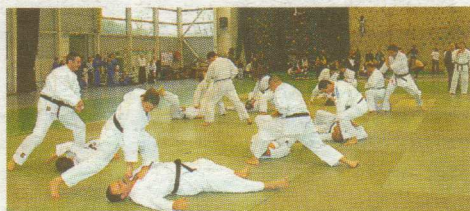
Avec l'aïkido et le viet vo dao, le club de taïjitsu de Montigny a fait une démonstration de ses techniques.